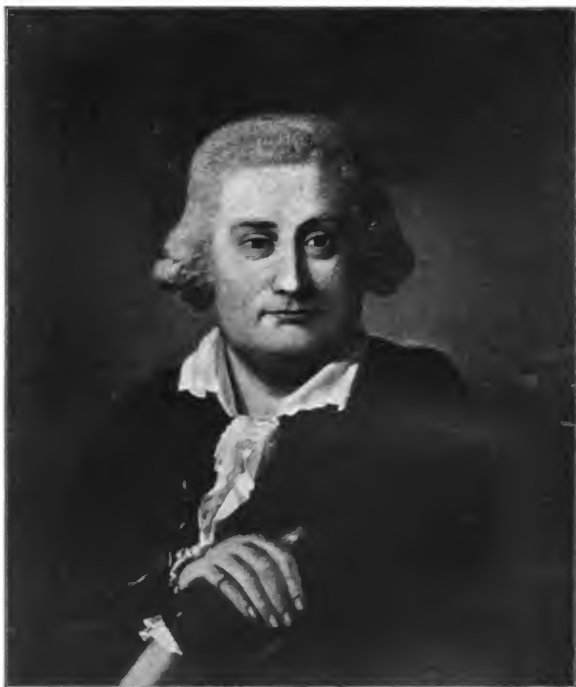
August Wilhelm Iffland. Nach einem Oelgemälde aus der Mannheimer Zeit. (Rüchauercher Nachlaß.)